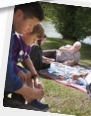
Συνάντηση με φίλο